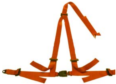
Photographie non contractuelle