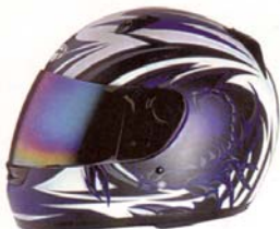
Casque enfant et adulte " STROMER "