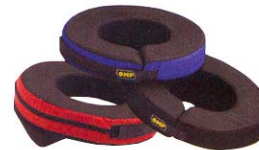
Tour de cou " OMP " " NEW "