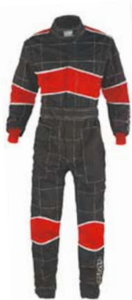
Combinaison BLAST (pilote OMP)