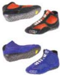
Bottines OMP " Compétition "