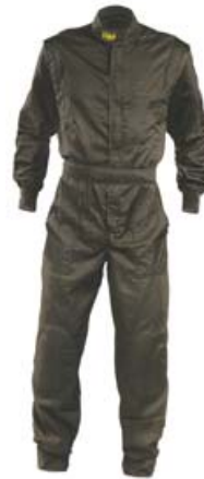
Combinaison adulte SUMMER (pilote OMP)